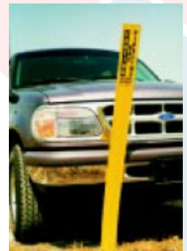
Resistente al impacto