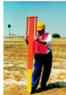
Instalación con un solo operador