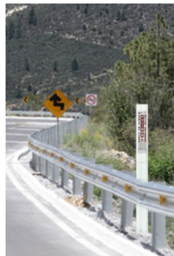
Señalamiento en carreteras

*Color: A (amarillo), W (blanco), N (naranja), R (rojo), V (verde), Z (azul marino)