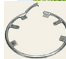
Aro Protector (Opcional )

B: Existe una placa con agarradera ( P/N 28120), especial para cuando se hace el sobre tejido.